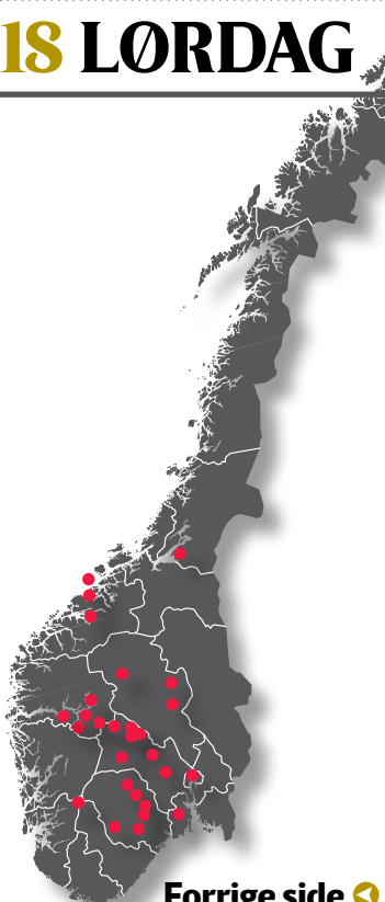
Forrige side ◀ Norske stavkirker