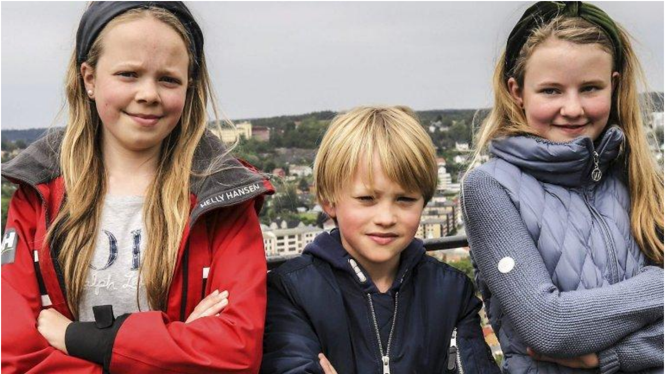
Ta bedre vare på planeten vår!