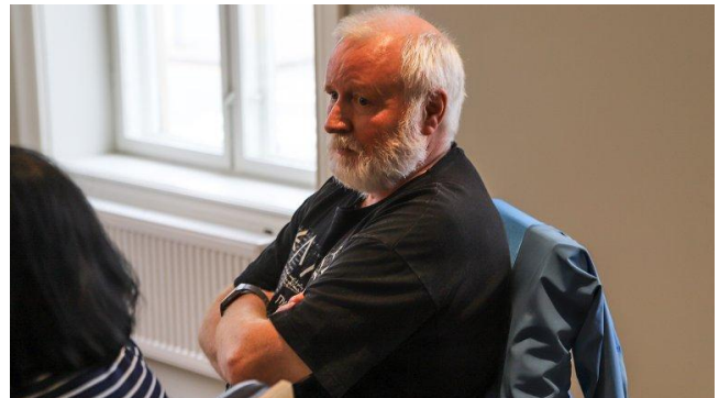
YTRING til saken «Mer enn 2000 arbeidstimer «forsvunnet» ved en skole i Halden»