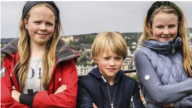
Ta bedre vare på planeten vår!