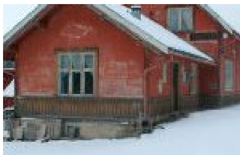
Bane NOR vil rive Barkald stasjon