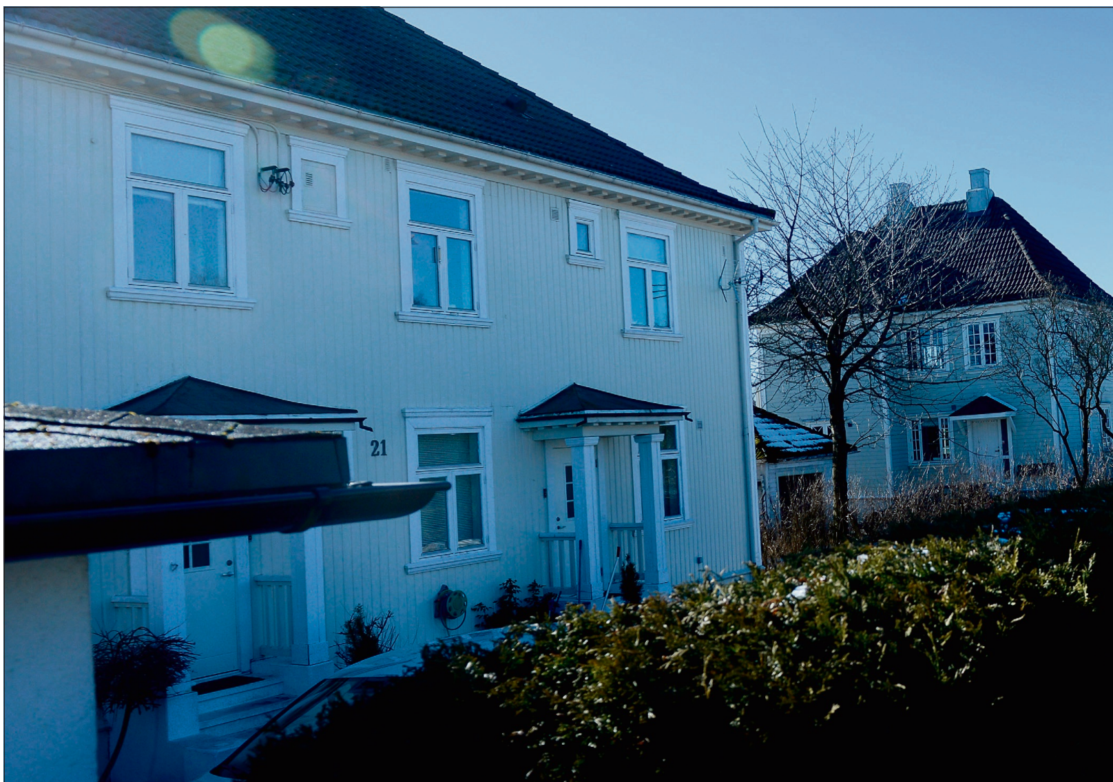
RØDLISTA: Fortidsminneforeningen har vurdert Nøtterø hageby, Teie, som et «veldig viktig historisk bygningsmiljø». Fra før er deler av hagebyen oppført på Riksantikvarens liste over områder av regional og nasjonal betydning. Dette bildet er tatt i Øgårdsveien.