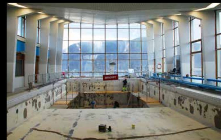
Renovering av bassenget i Alfheim Svømmehall har vært en gjenganger i budsjettene, men lite ble gjort. Høsten 2016 fikk man til et løft. Her legges ny duk i bassengkaret.