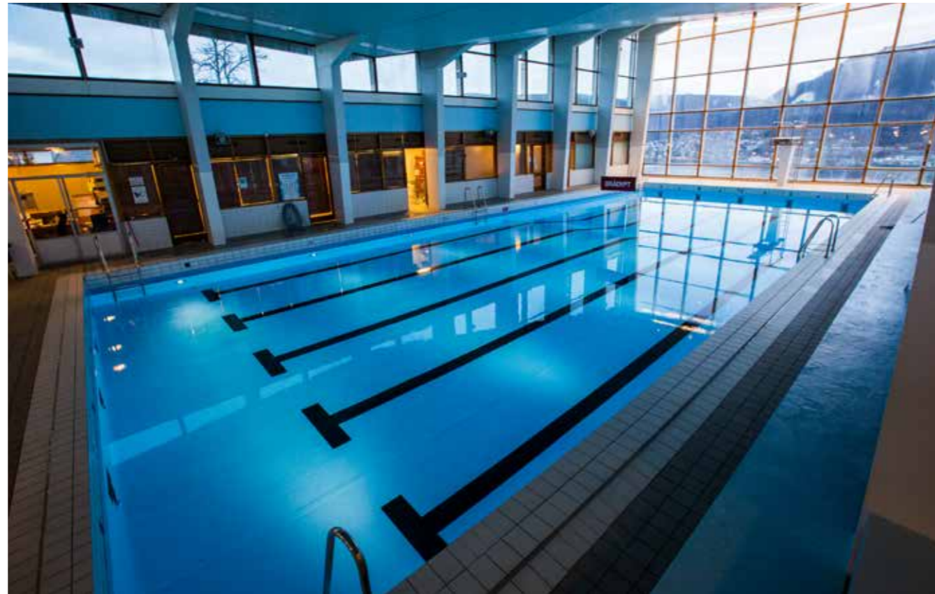
«Nye» Alfheim Svømmehall åpnet 18. november 2016. Nå kan brukerne igjen nyte en svømmetur med formidabel utsikt.