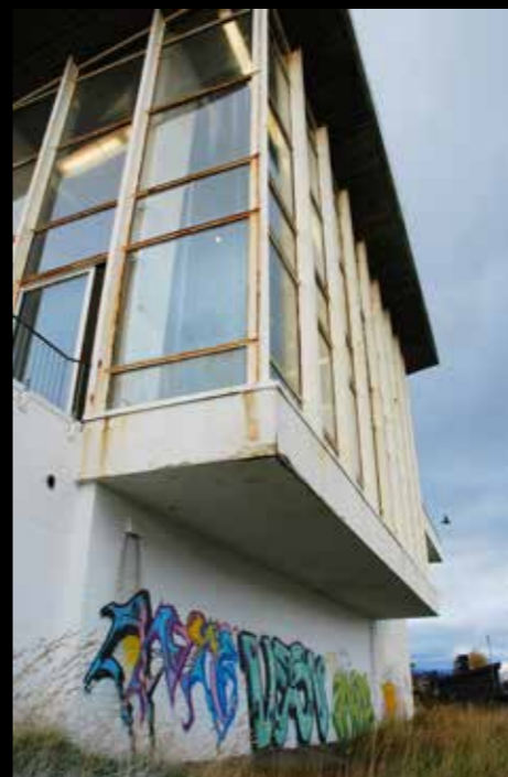
En gang et skinnende hvitt landemerke over byen. I dag vitner rust og graffiti om et årelangt forfall.