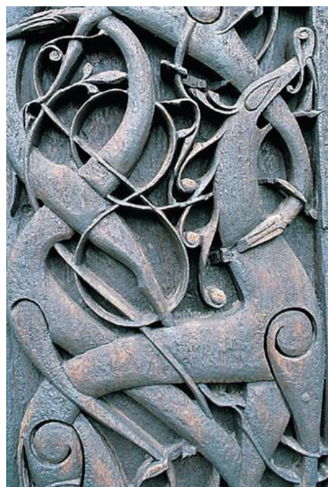
Utsnitt av Urnesportalen. Treskurd.