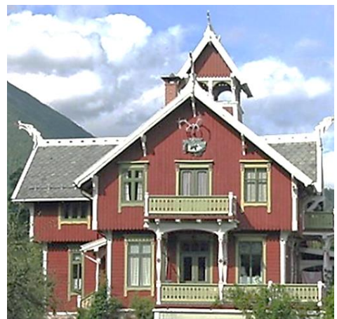
Villa «Strandheim» i Balestrand.