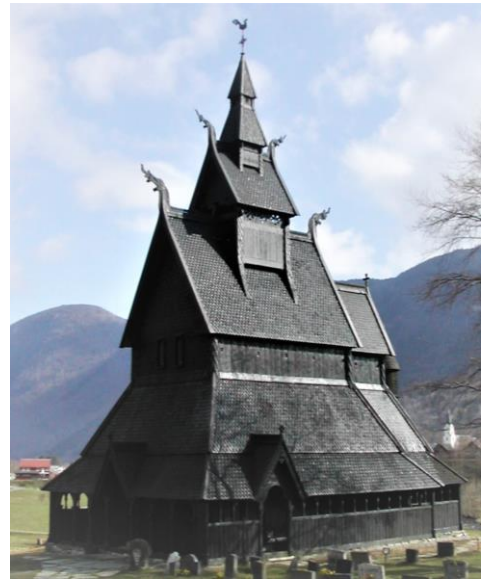
Hopperstad stavkyrkje, Vik