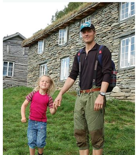
Høgdegarden Fuglesteg. Fortun i Luster No DNT-hytte