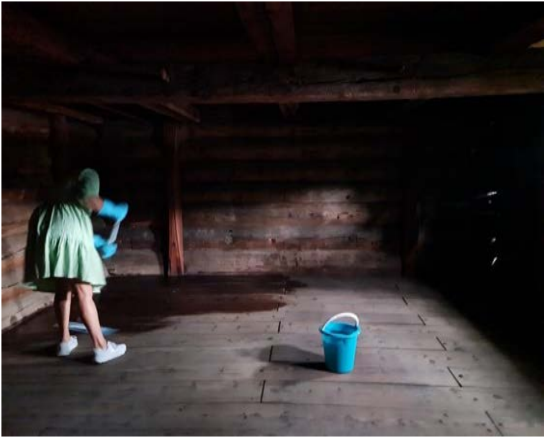
Golvask med varmt vatn før jubileumsarrangement