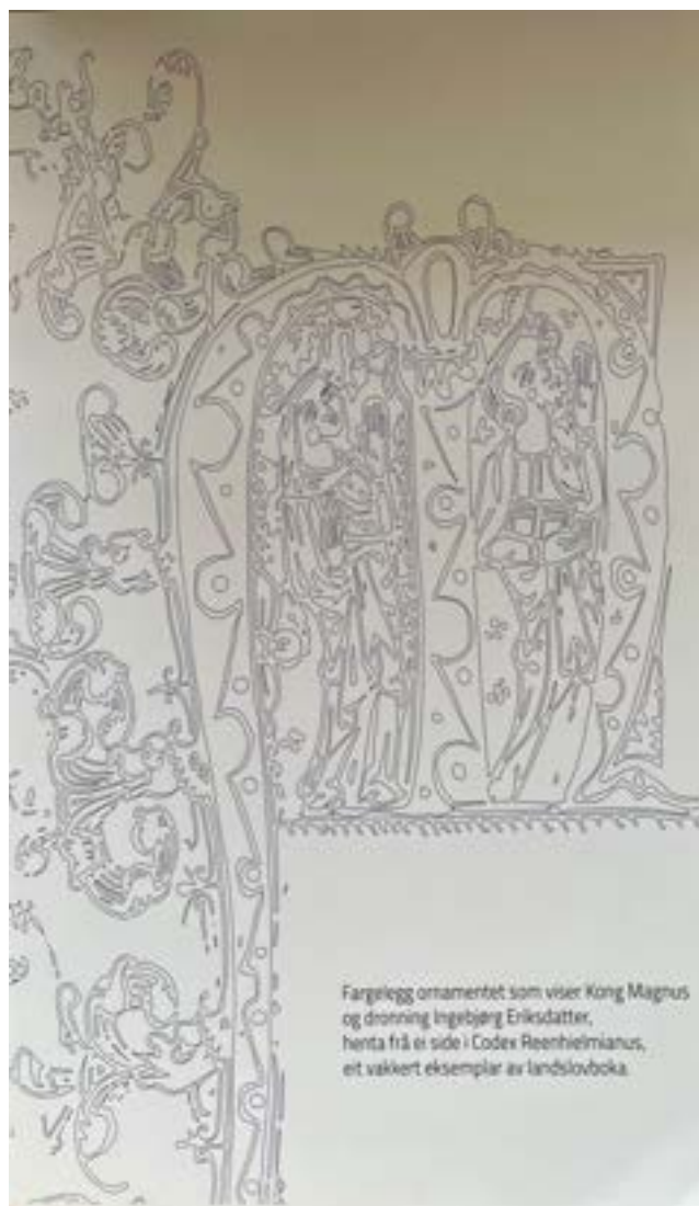
Fargelegg ornamentet som viser Kong Magnus og dronning Ingebjørg Eriksdatter, henta frå ei side i Codex Reenhielmannus, eit vakvert eksemplar av landslovboka.

3. Foredragsdragsrekkje med ei avsluttande veitle "Skål gode grannar" i Finnesloftet