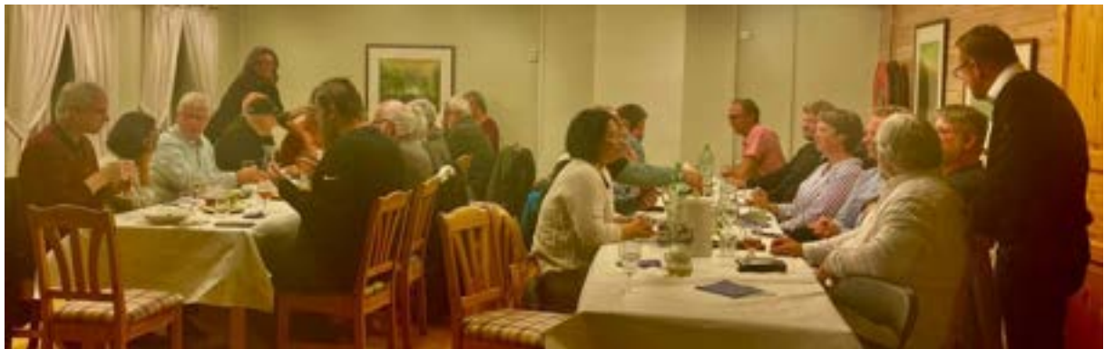
Frå middagen på Vestnorsk kulturakademi