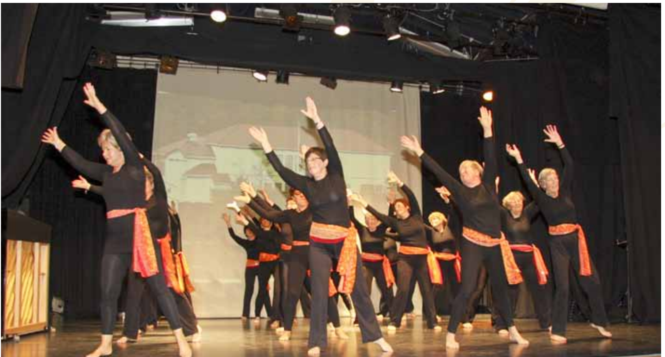
Ei siste helsing frå turndamene

"Husets formaal er først og fremst aa dekke de to foreninger som eier huset sitt behov, og dernest tjene som et forsamlingslokale for bygden".