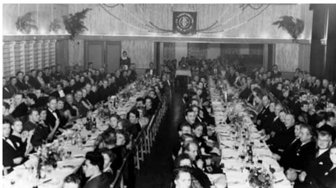
50-årsjubileet til Os Turnforening i 1955.

Inntektene frå kinoen og dansane auka jamt utover på 50-talet, og det var desse inntektene som i praksis løfta Fjellheim fram desse åra. Leigeinntekter frå skulane var