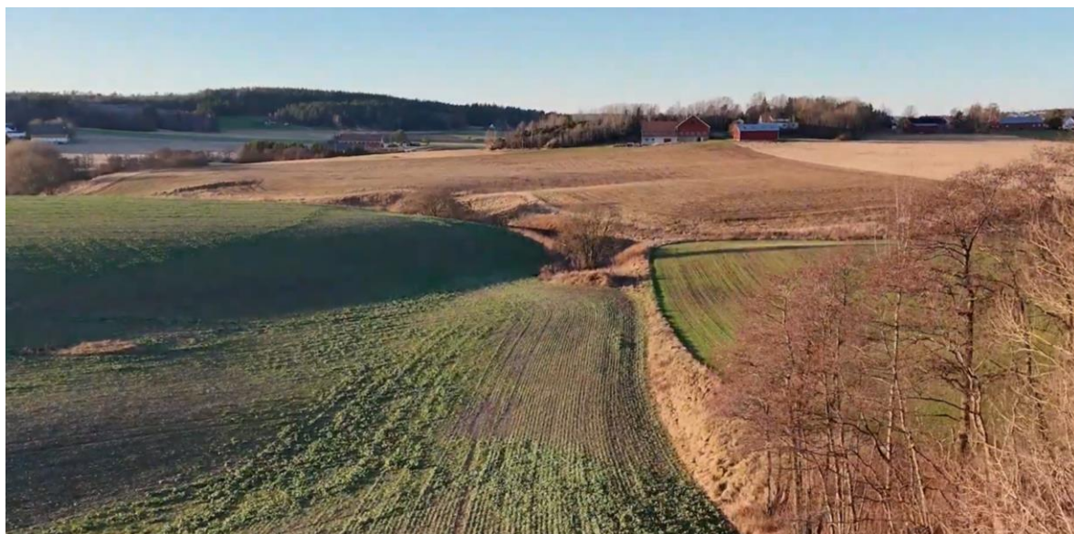
Figur 5 Dronefoto av landskapet sett fra helleristningsfeltet i figur 4. Tiltaksområdet er kollen i bakgrunnen.