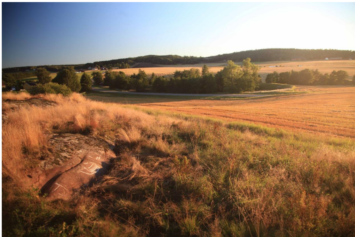
Figur 1 Bildet viser en nyfunnet helleristning i landskapet nord for Borge varde. Pukkverket og industriområdet skal ligge i kollen i bakgrunnen.