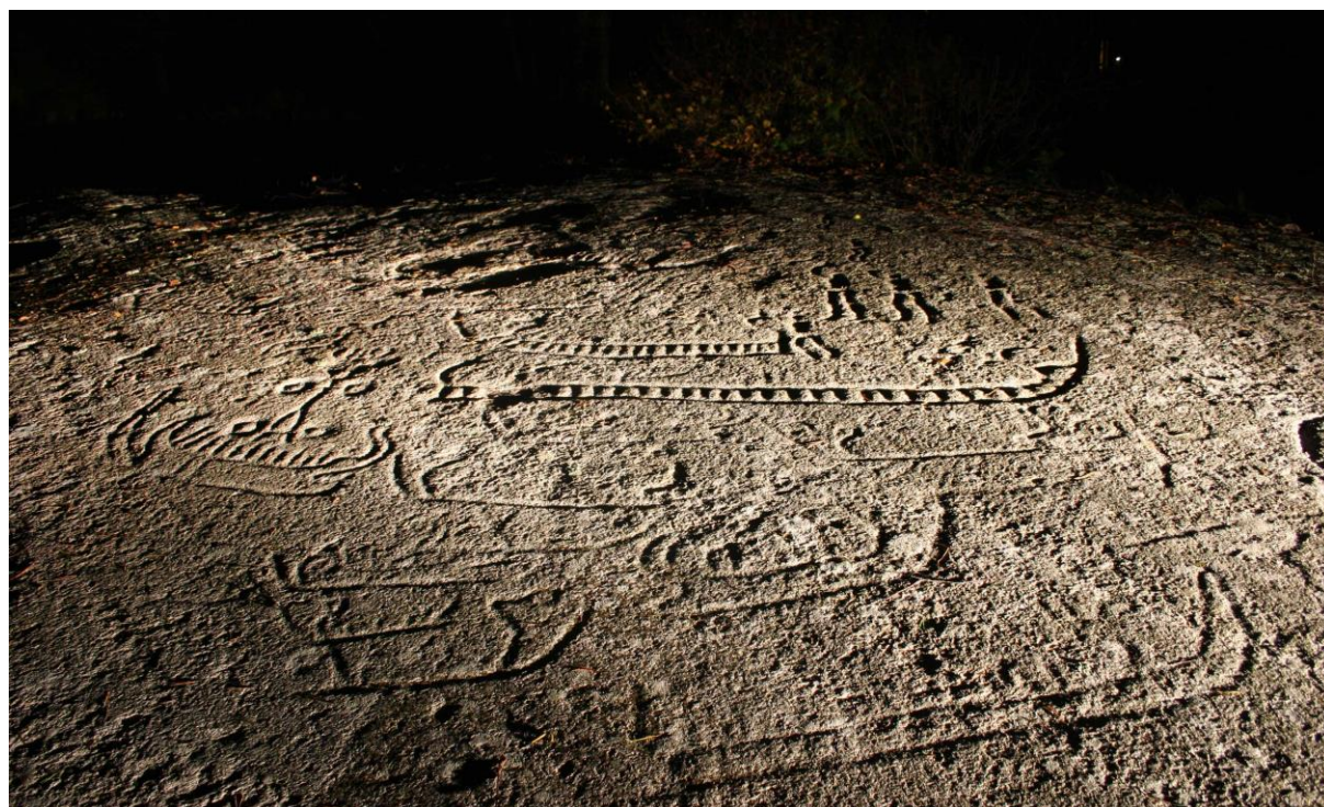
Figur 10 På Lilleborge, like vest for planområdet finnes et av landets største og flotteste helleristningsfelt fra bronsealderen. Over hele berget finnes mengder av skip, mennesker, dyr og andre figurer. Fra helleristningsfeltet er det direkte innsyn til planområdet.