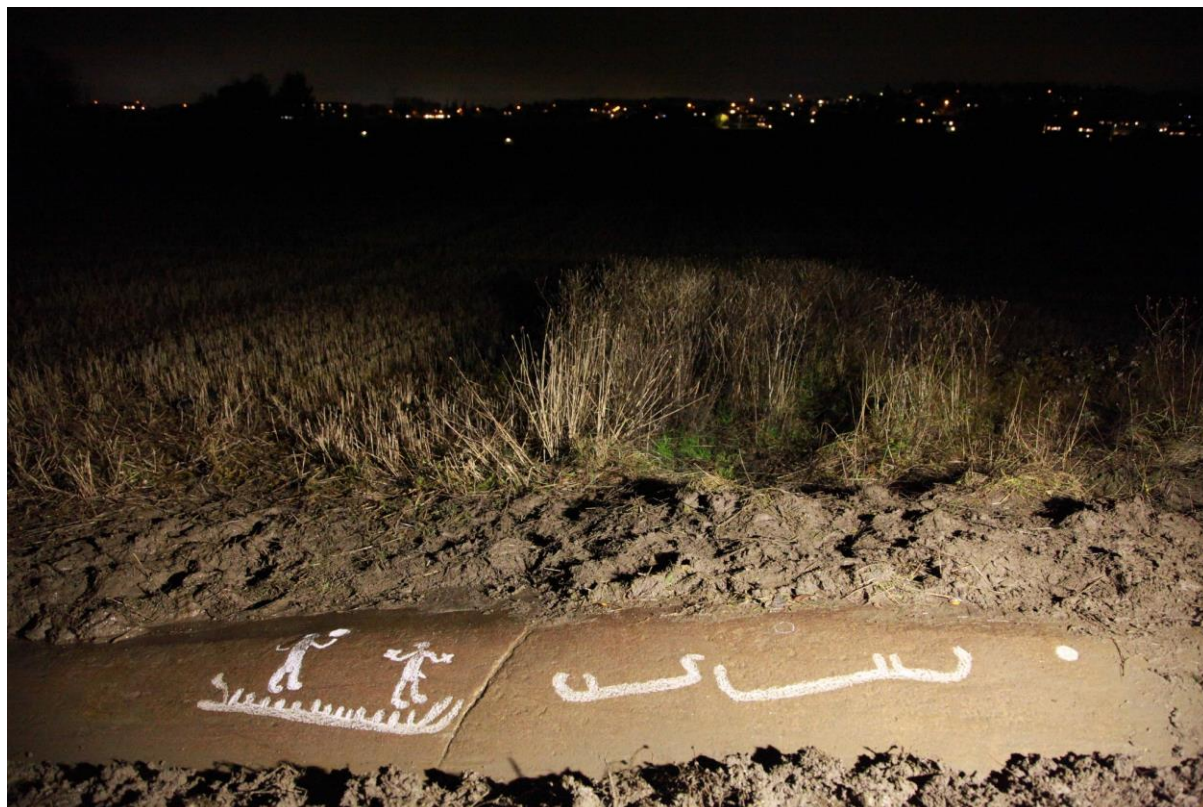
Figur 9 Helleristningsfelt på Balterød, i kulturlandskapet like sørvest for planområdet. Feltet er ett av mange nye helleristningsfelt som har blitt funnet i dette området de siste par årene.