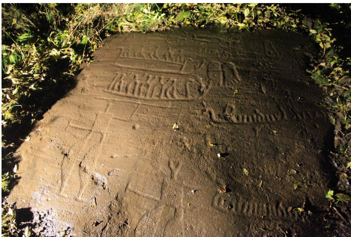
Figur 8 Årumfjella langs den gamle bronsealdervejen nordøst for planområdet er et av de rikeste helleristningsområdene fra bronsealderen i landet. Over 50 helleristningsfelt ligger på rekke og rad.