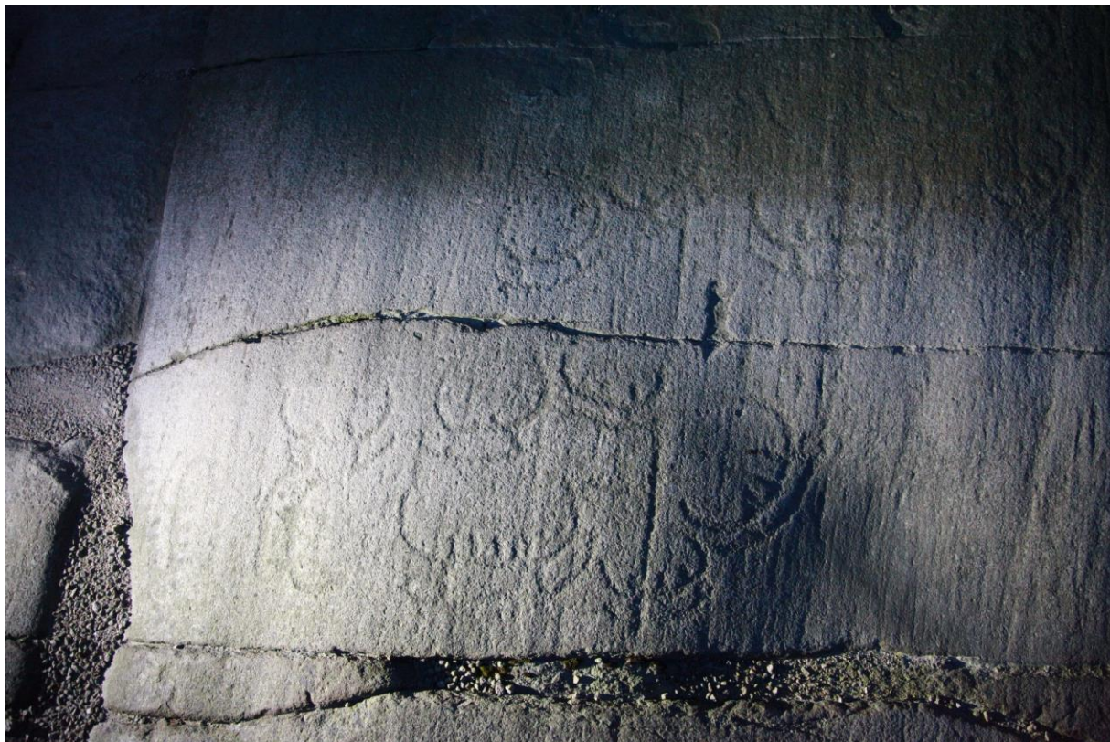
Figur 7 Denne flotte gruppen med små skip finnes på Tofteberg, nært inntil planområdet.