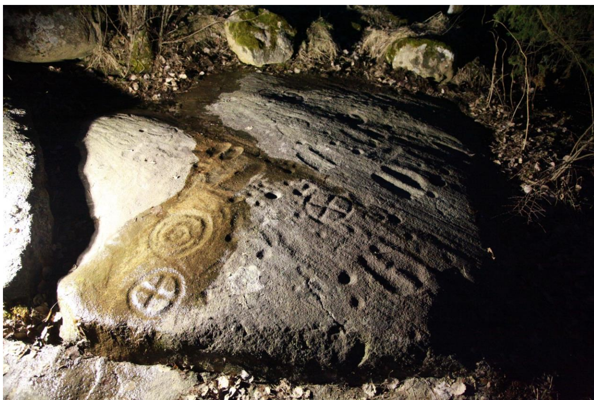
Figur 1 Helleristningene på Skjælin ligger i kulturlandskapet like øst for planområdet. Med sine mengder av sirkler, fotsåler, skålgroper, mennesker og store skip er det et av de flotteste i landet. Fra stedet er det direkte syn mot kollen som skal romme Viken park.