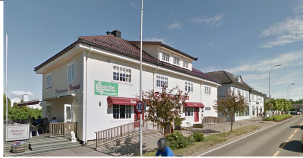
Smidsrødveien 7.