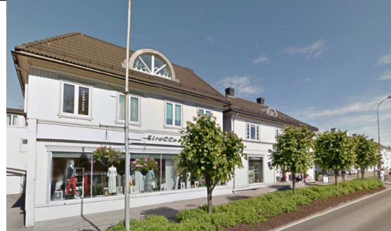
Smidsrødveien 7B.

Smidsrødveien 7 B er en opprinnelige Teiebygning med halvvalmet tak, smårutete vinduer og trepanel. Samme type bygning som Smidsrødveien 5 og øvrige bygninger rundt torvet. Bygningene har miljøverdi og er viktig for gateløpet. Smidsrødveien 7 B er tilført et volum mot Smidsrødveien 7. Oppføringsår er ikke kjent, men bygningsvolumet glir inn i gateløpet og er godt tilpasset både i volum og formspråk.