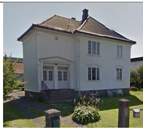
Arenfeldtsvei 14.