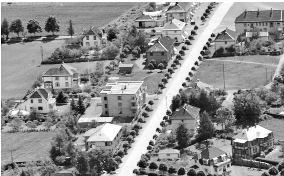
Utsnitt av flyfoto, trolig fra tidlig 1930-tallet.