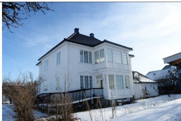
Arenfeldtsvei 14. Bilde fra Tønsbergs blad, februar 2017.

Bygninger med antikvarisk verdi og med miljøverdi innenfor planområdet.