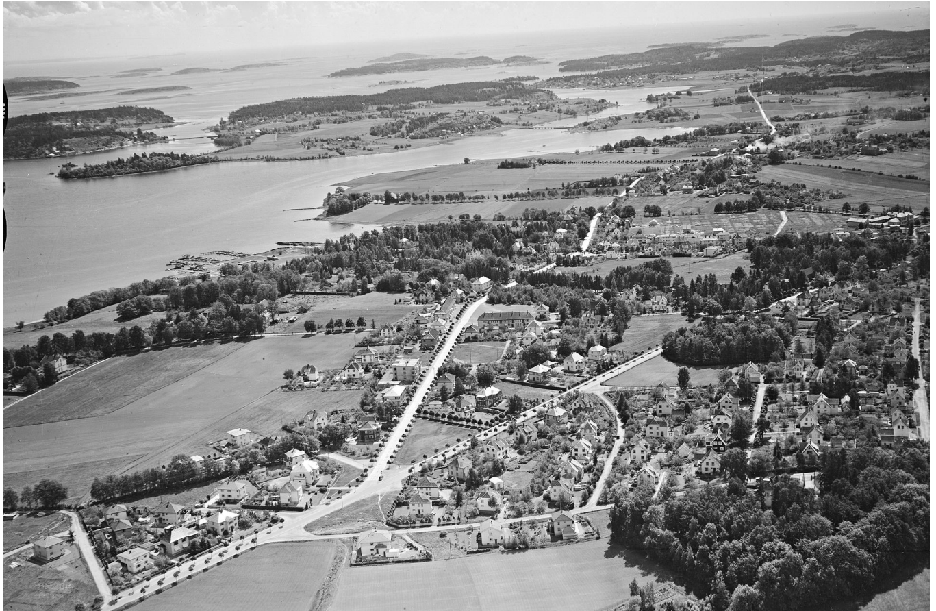
Teie, antakelig 1930-tallet.