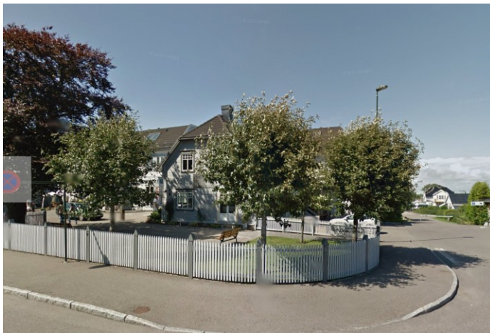
Ørsnesalléen 31, Villa Hageby.

Smidsrødveien 7 B er en opprinnelige Teiebygning med halvvalmet tak, smårutete vinduer og trepanel. Samme type bygning som Smidsrødveien 5 og øvrige bygninger rundt torvet. Bygningene har miljøverdi og er viktig for gateløpet. Smidsrødveien 7 B er tilført et volum mot Smidsrødveien 7. Oppføringsår er ikke kjent, men bygningsvolumet glir inn i gateløpet og er godt tilpasset både i volum og formspråk.