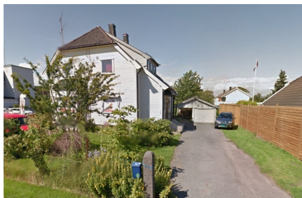
Arenfeldts vei 11.

I reguleringsplanen er bygningen er planlagt revet for å gi plass til et leilighetskompleks.